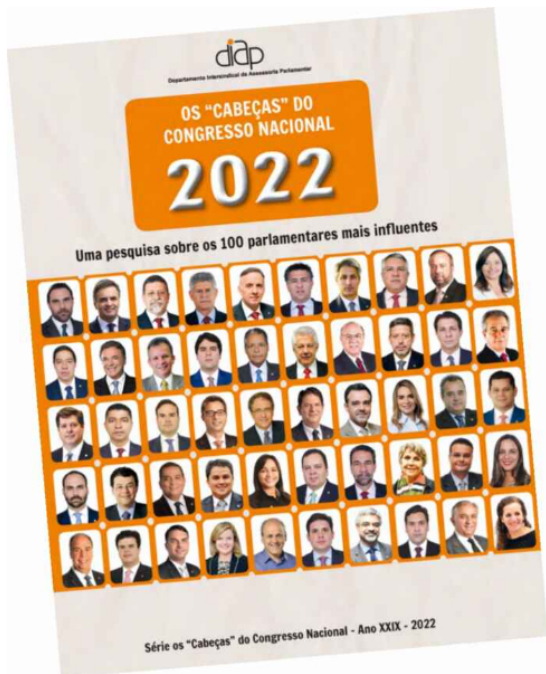
Capa do "Cabeças do Congresso Nacional 2022", produzido pelo DIAP