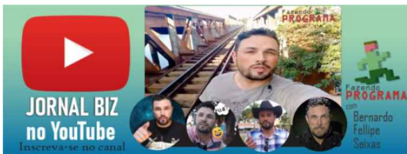
Inscreva-se no canal do Jornal Biz no YouTube

Giordano assumiu a cadeira de Major Olímpio, falecido em março de 2021, vítima da Covid. José Serra foi deputado federal e governador de São Paulo, e Gabrilli foi vereadora e também deputada federal, antes de serem eleitos senadores.