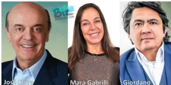
Os três senadores por SP não aparecem no ranking

Um ponto negativo para os paulistas é o fato de nenhum senador constar na lista de melhores. José Serra e Mara Gabrilli, do PSDB, e Giordano, do MDB, são figuras completamente apagadas.